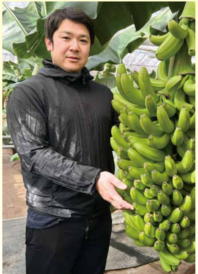
(株)井上農園 専務取締役

ただ、そもそも無農薬栽培であるため、「害虫の駆除では葉に付いたハダニやカイガラムシなどを一枚一枚、布を使って手でふき取っています」といった苦労もあるそうです。しかも、バナナの栽培は