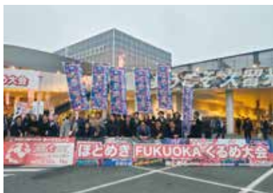
相模原からの参加者で記念撮影

全国3万人超のメンバーで組織される日本YEGでは、1年間の事業の集大成として全国大会を開催していま