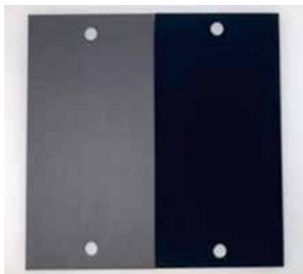
同社開発の低反射アルマイト（右） 従来の艶消黒アルマイト（左）

紫外（可視・赤外領域）の光を効果的に吸収しつつ、膜強度を飛躍的に高めた低反射材料を開発。発塵せず、耐熱性・耐紫外線性にも優れることから、光センサーやそれを用いるさまざまな機器に使用することで、光ノイズを低減し、測定精度の向上に寄与。発塵レス・耐熱性・耐紫外線性の観点から、今後は航空宇宙、医療、気象、防災、自動車など、幅広い用途や厳しい使用環境での応用が期待される技術です。