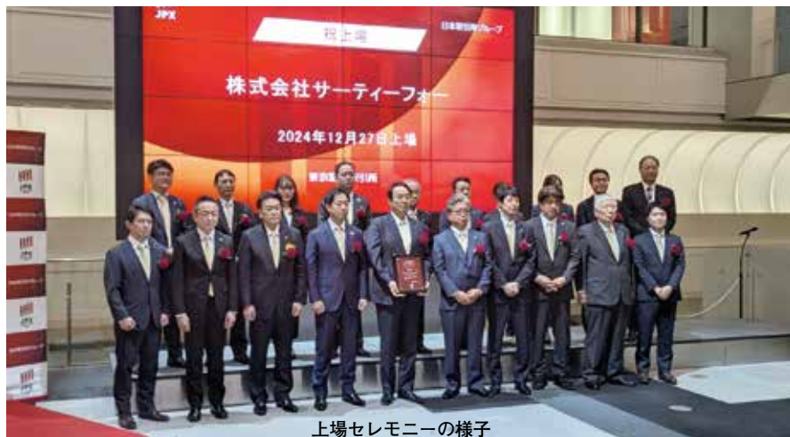
上場セレモニーの様子

上場したことの大きなメリットとして「会社の信用度アップ」を挙げています。具体的には「人材を採用するにしても、安心してもらえます」