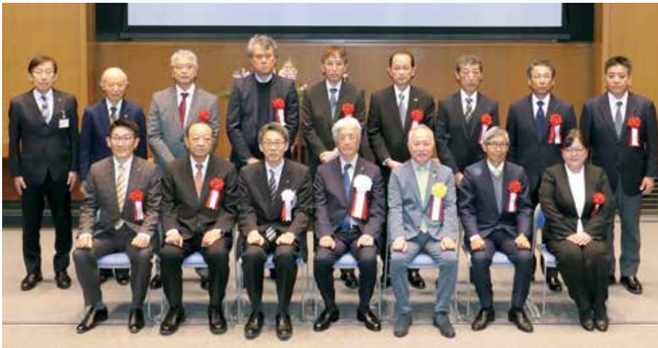
当所からの受賞者