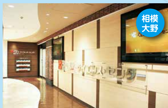
ヘルス・サイエンス・センター