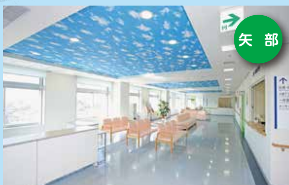
JCHO(ジェイコー)相模野病院