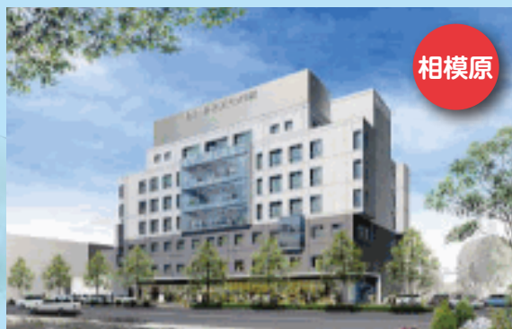
総合相模更生病院