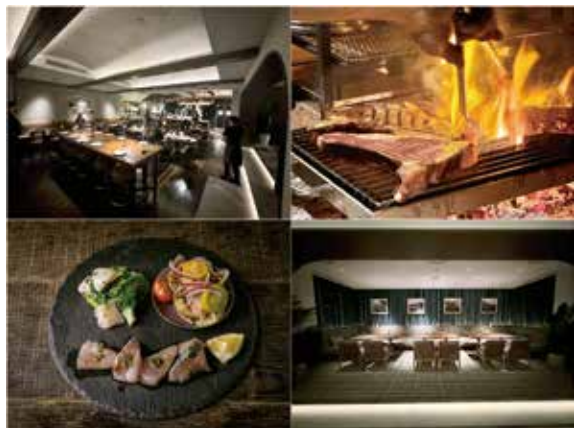
レストラン「MONDO（モンド）」