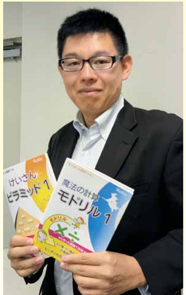
※個人の方も横山の中村書店やamazonでご購入いただけます