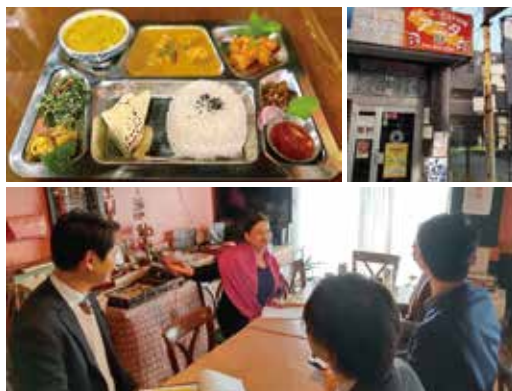
飲食業部門大賞のエスニック料理ANITAの臨店審査の様子