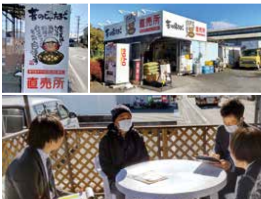
小売・サービス業部門大賞の昔の味たまご農場の臨店審査の様子