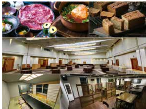
ゲートウェイ・さがみはら各店舗