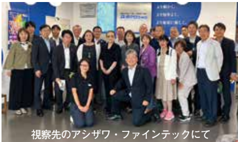
視察先のアシザワ・ファインテックにて

当部会で は部会内の 連携をさら に強めながら、引き続き市内サービ ス業発展のための事業を検討し、実 施していきます。