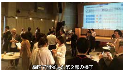
緑区で開催した第2部の様子

当所は、「会員ビジネス交流会」の中央区版を7月5日に市立産業会館で、緑区版を10月5日に橋本HKLoungeでそれぞれ開催しました。2会場の開催で延べ60社84名が参加しました。