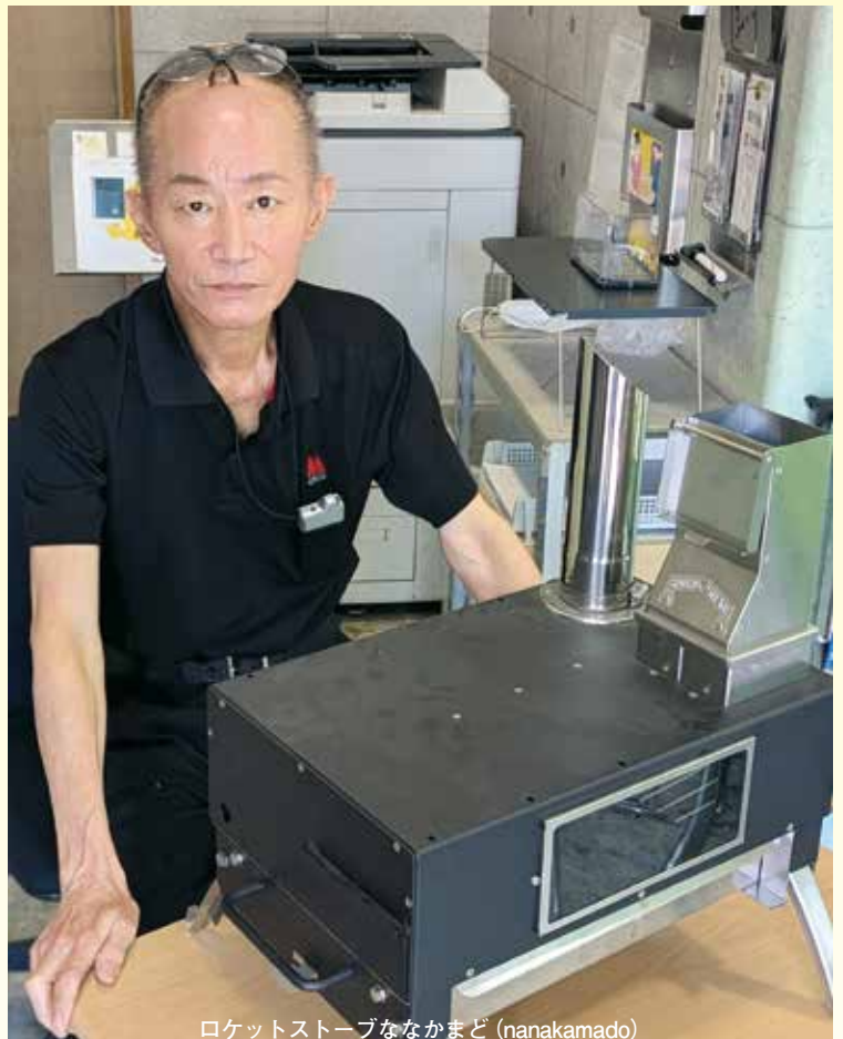
ロケットストーブななかまど (nanakamado)

えて出た一酸化炭素や未燃焼のガスを再度燃やしてしまう技術のことです。同製品はキャンプ場で使っても煙がほとんど立たないため周囲に迷惑をかけることなく、しかも効率的に薪・ペレットを燃焼できるので燃料の消費量が抑えられます。まだ販売したばかりですが「昨今の