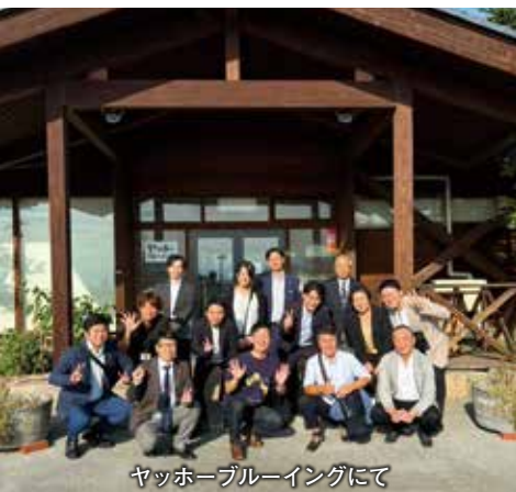
ヤッホーブルーイングにて

当部会では、引き続き模範となる 企業や独特な経営手法を持っている 企業の視察などを通じ、市内企業の 発展の一助となる施策を実施してい きます。