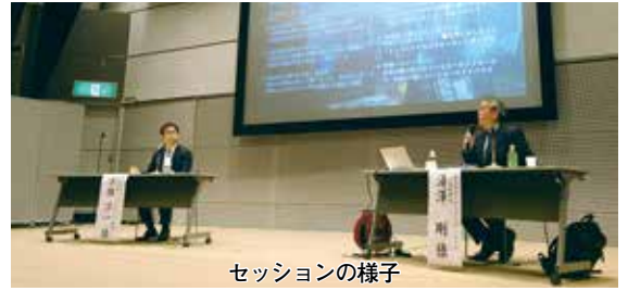
セッションの様子