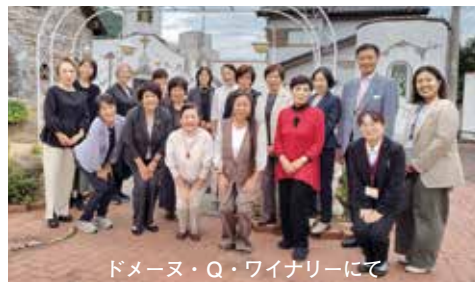
ドメヌ・Q・ワイナリーにて