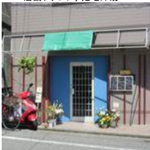
店舗テナント予定地外観