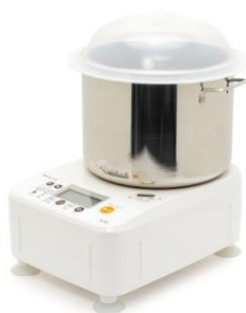
パンニーダー(パンこね機)